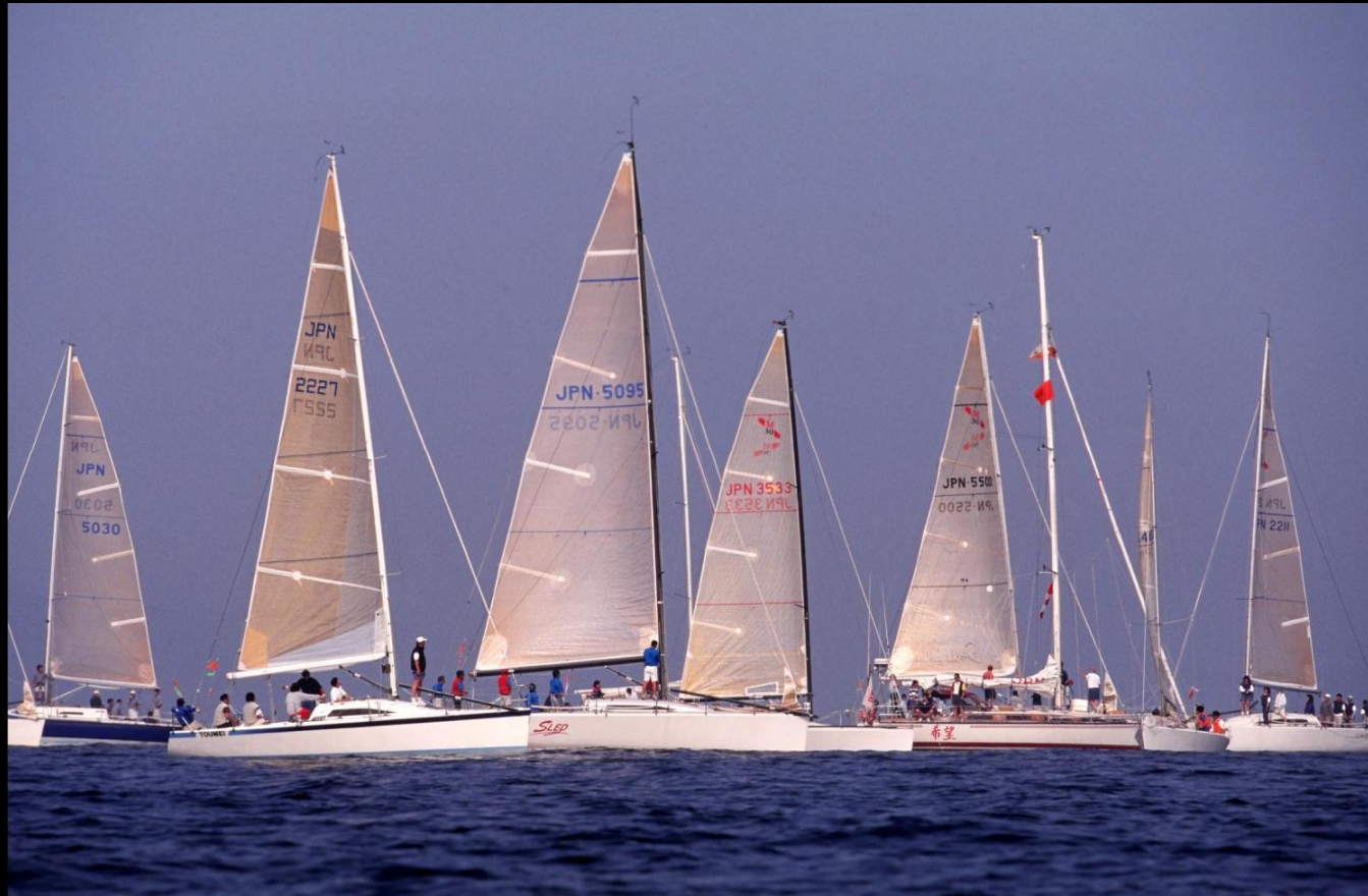
「静寂の時」 スタートライン付近に静かに集まる戦闘集団。風位、風力、潮位、潮流、などを見ながら有利なポジションを狙います。