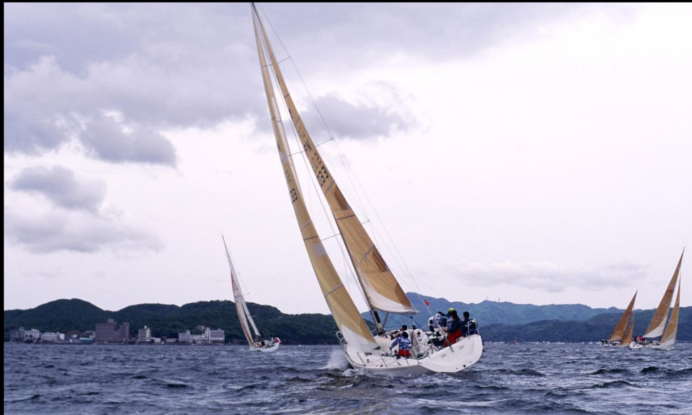
「追撃」 クローズホールドで先行艇を追います。角度とスピード、どちらをとるかがタクティクス。