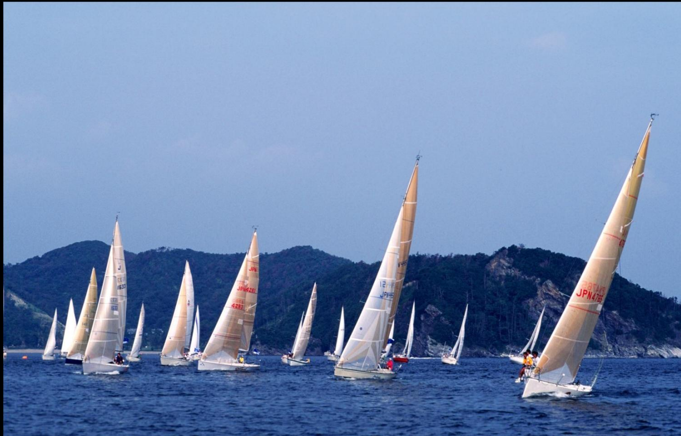
「さわやかな風にのって」 さわやかな風にのって一斉にスタート。