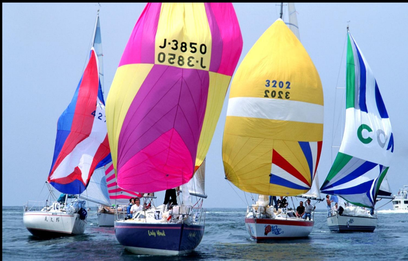
「美しき帆走」 微風のスピラン。各艇デザインを凝らしてとても綺麗な風景です。