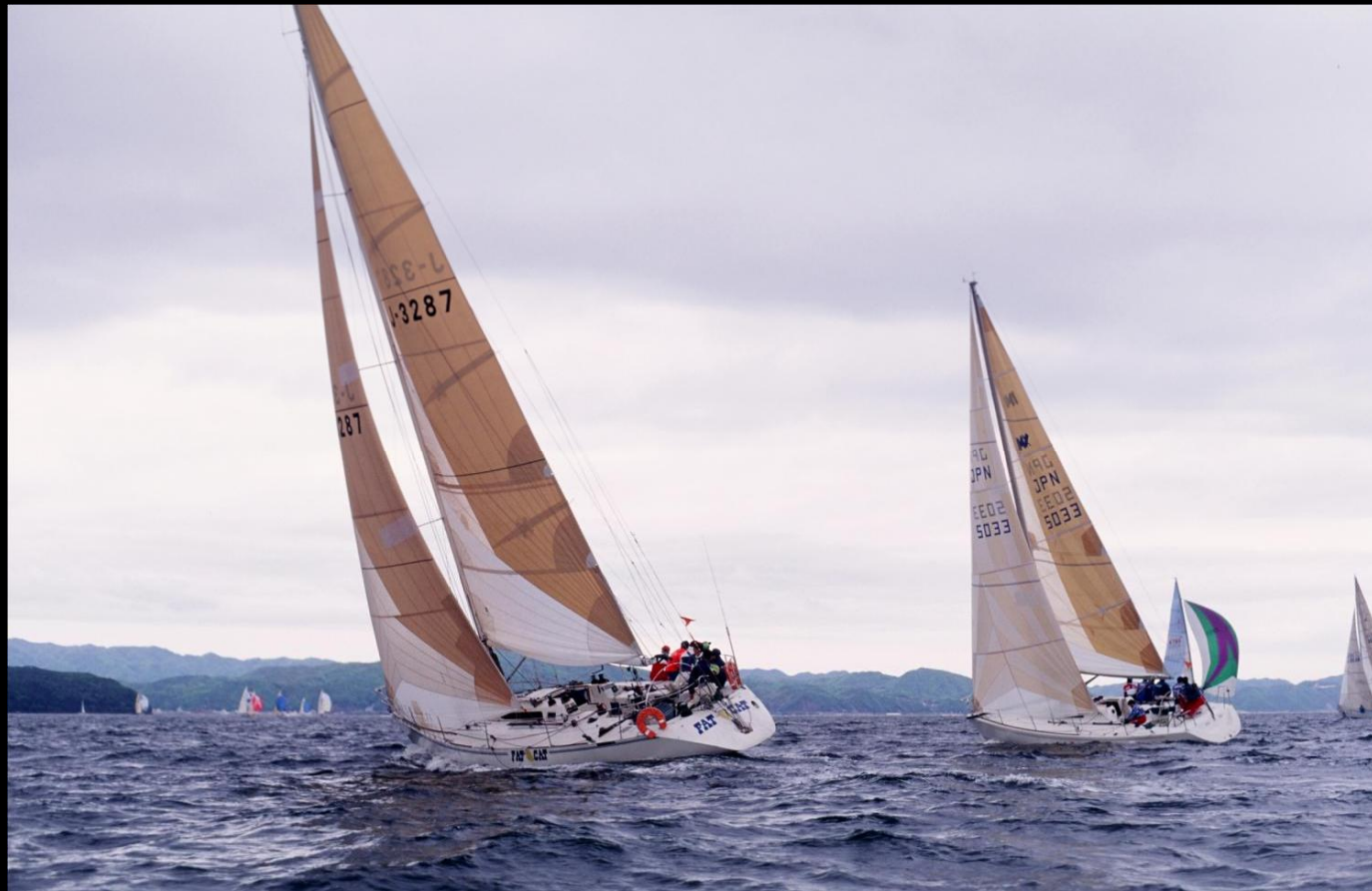
「デッドヒート」 クローズホールドで競い合う2艇。