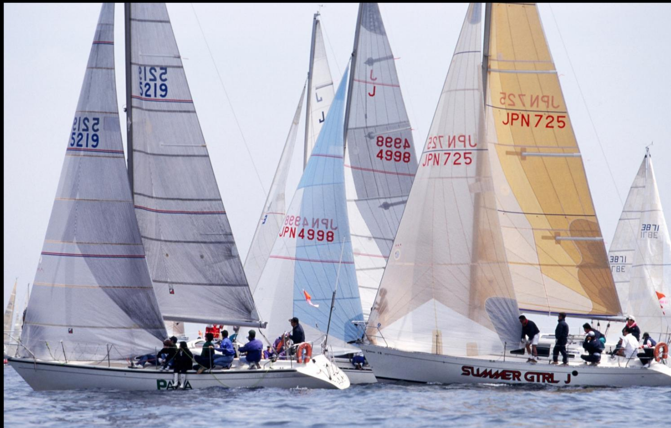
「GO GO GO」 オレンジカップスタート直後、新西宮KYC「Summer Girl」と徳島YC「PAWA」の先行争いです。