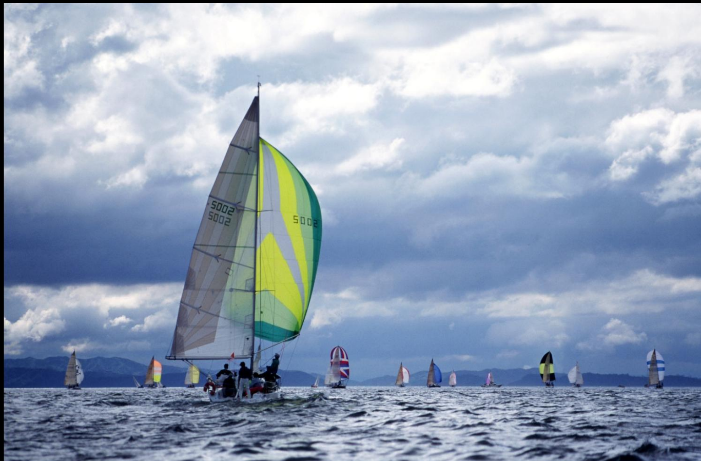
「ゴールへ」 スピンがきれいに風を受けて洲本沖から和歌山加太瀬戸方面に向けての快走です