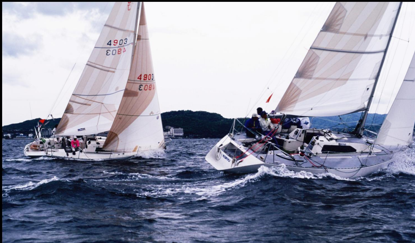
「デッドヒート」 風上に向かったの帆走するクローズホールドはクルーの腕の見せ所です。