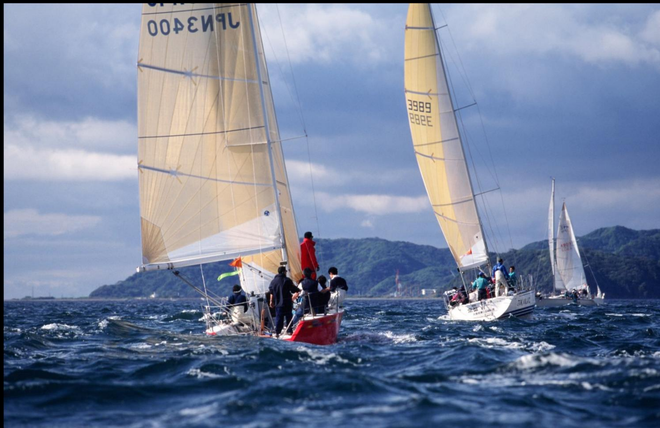
「射程距離」 由良瀬戸をバックに先行の艇はタック中。「さあ続いていくぞ」という声が聞こえてきそうです。