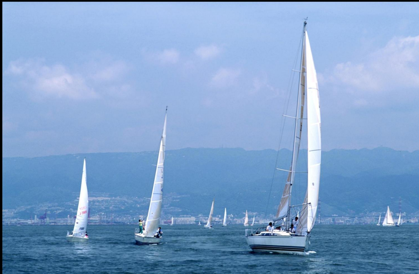
「春の風」 澄み切った空気の大坂湾で先頭を帆走するのは懐かしいKONAKAI(X412) 左端はカレラ29。