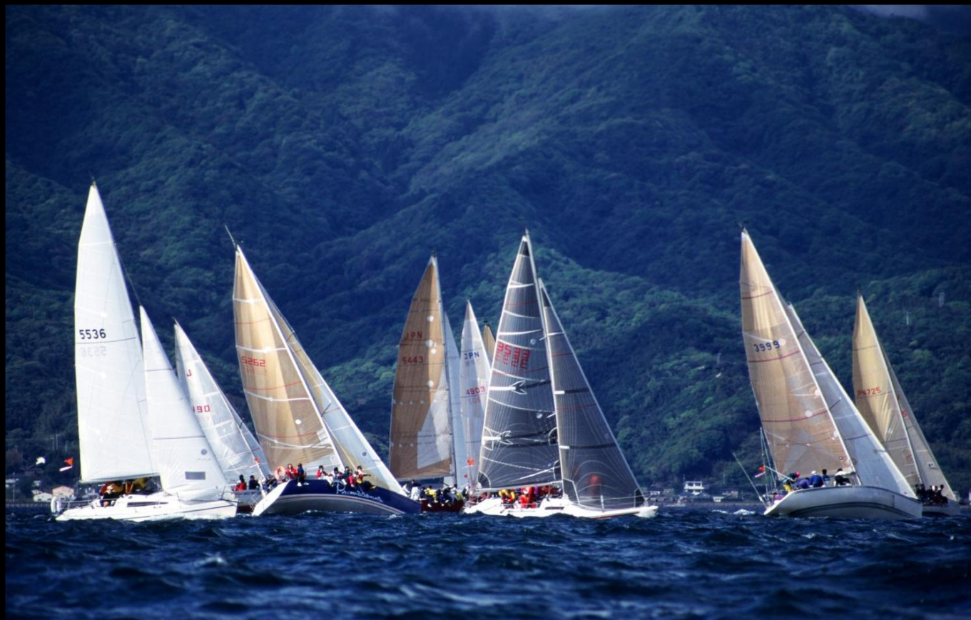
「激戦」 ポートタック(進行方向左から風を受ける)とスターボードタック(進行方向右から風を受ける)が入り乱れての大混戦です。