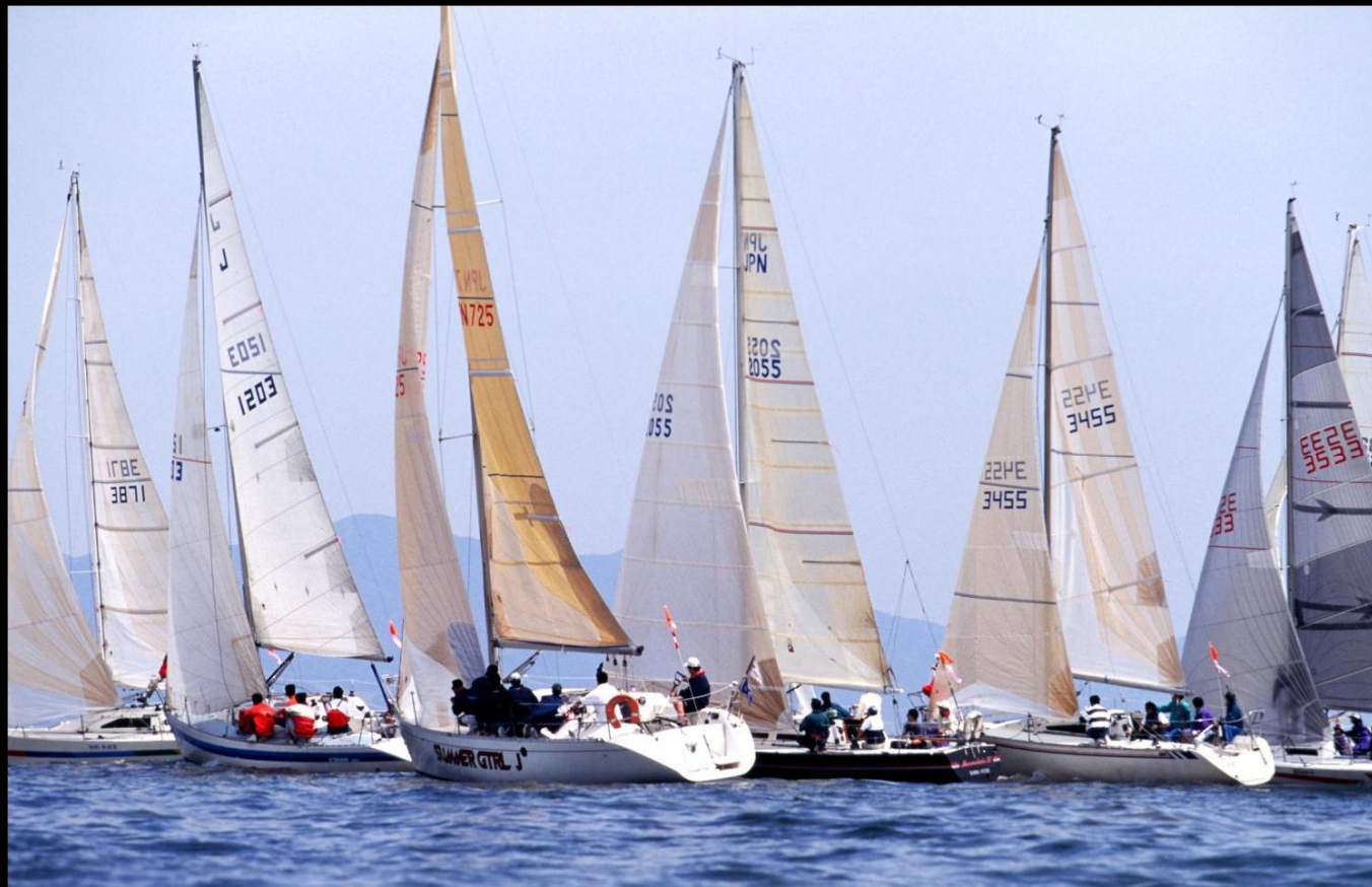
「スタート」 怒号が飛び交う オレンジカップのスタート風景です。