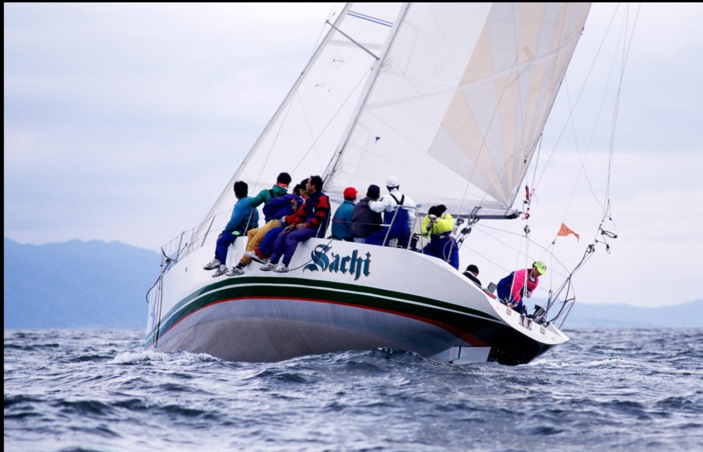
「Sachi」 サントピア沖で風上に向かって帆走するクローズホールド。クルーの息遣いが伝わってきます。