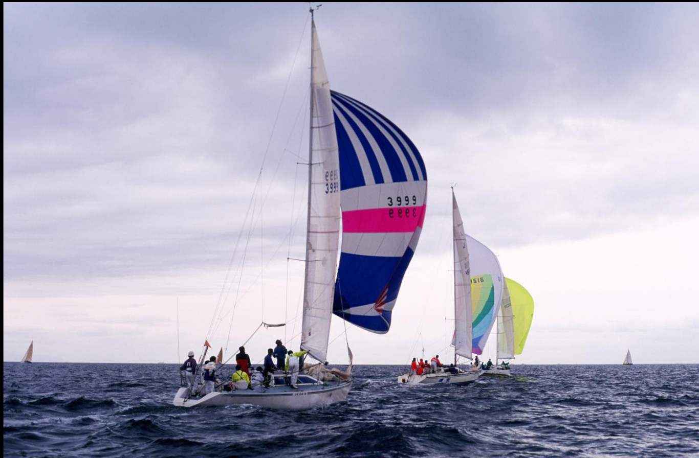
「快走」 先行艇とともに見事なスピランを見せるセールNo.3999 淡輪のEMIです。