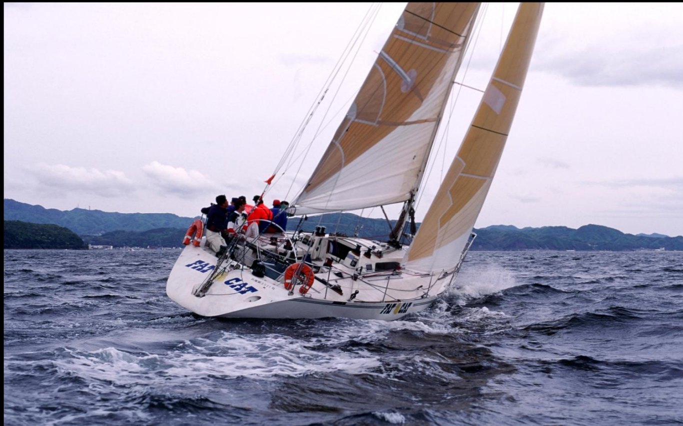
「疾走」 サントピア沖ですばらしい風を受けて疾走FAT CATのクローズホールドです。