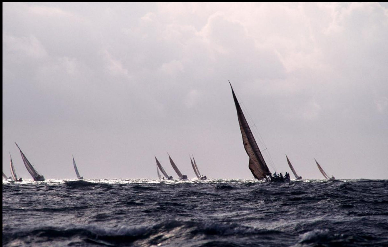
「嵐へ」 荒れた海をもろともせずに激走する雄姿です。