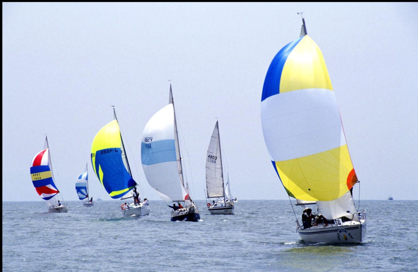
「陽光」 風をいっぱいを受けてのスピランです。