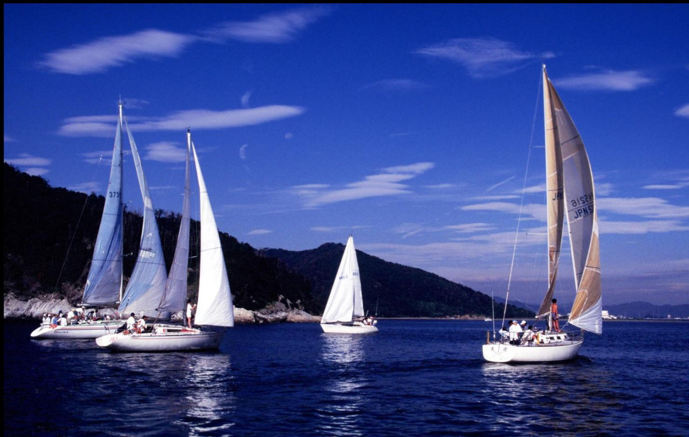
「群 青」 徳島ヨットクラブ月例レースでパル&パル、メリーペッカー、スノーグースがスタートラインに向かうところです。