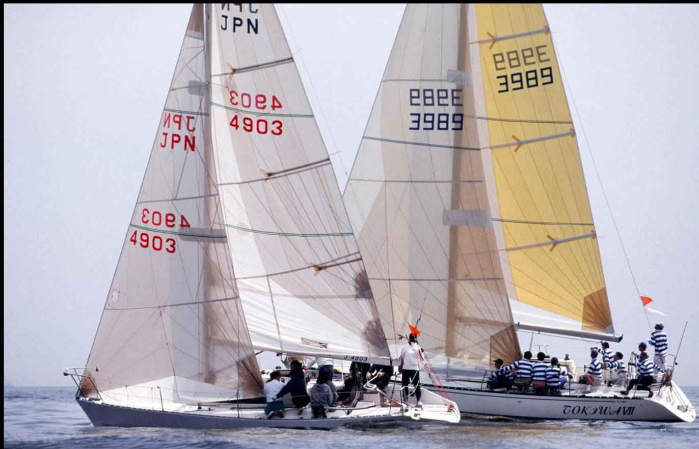
「ダッシュ」 オレンジカップスタート直後の先行争いです。