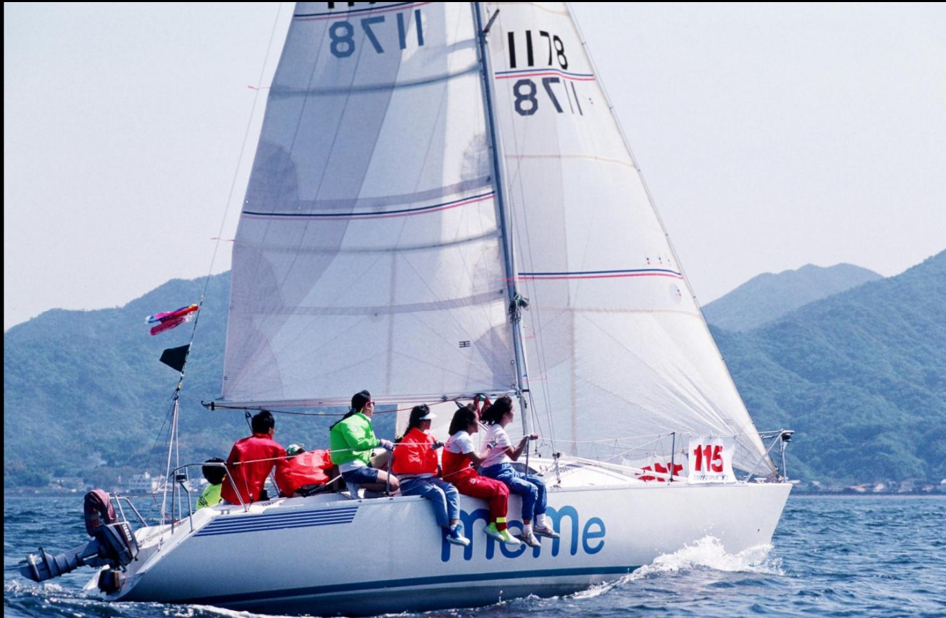
「5月の風」 女性だけのクルー「meme」