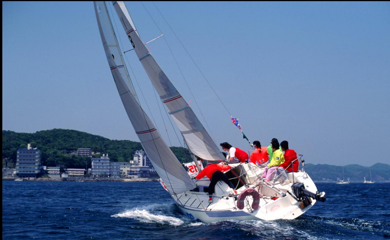
「meme 快走」 日本のサウサリートヨットクラブのmemeは全て女性のクルーでひとときわ艶やか。