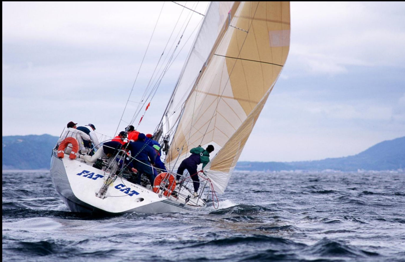
「タック !!」 タック(方向転換)直後。クルーも移動のまっ最中でセールを引き込もうとてんやわんやのコックピットです。